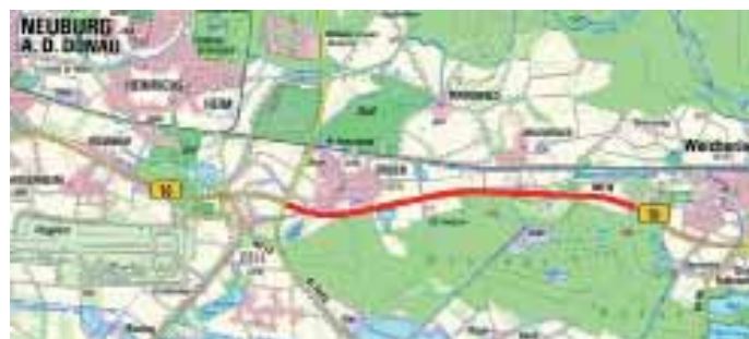
Abbildung: Darstellung der Baumaßnahme

Aufgrund von Rissen und Asphaltverdrückungen wird die B 16 auf rund 4,2 Kilometern zwischen der Zeller Kreuzung (der Kreuzung der B 16 mit der St 2043) und Weichering saniert. Die Zufahrt zum Tanklager der Fernleitungsbetriebsgesellschaft (FBG bzw. Muna) ist nur aus Richtung Weichering möglich. Damit der vielbefahrene Streckenabschnitt die hohen Belastungen des Schwerverkehrs künftig noch besser aufnehmen kann, wird der Asphaltaufbau baulich verstärkt.