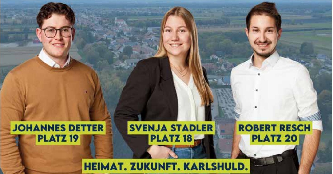
JOHANNES DETTER PLATZ 19

VORSTELLUNGSVERSAMMLUNG IN GRASHEIM BEIM KARMANN