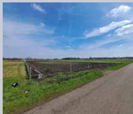
Ein Elektrozaun, der die Kiebitznester vor dem Fuchs schützen soll.

Landwirte können auch selbst Nester beim LBV melden und so helfen, den Kiebitzbestand besser im Blick zu haben. Am besten unter wiesenbrueeter.donaumoos@lbv.de . Entstehen dem Landwirt durch das Kiebitznest Erschwernisse bei der Bearbeitung können sie auch eine Entschädigung von 100 € pro Nest auf Acker und 50 € pro Nest auf Wiesen beantragen.