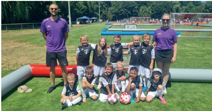
Festival beim SV Zuchering