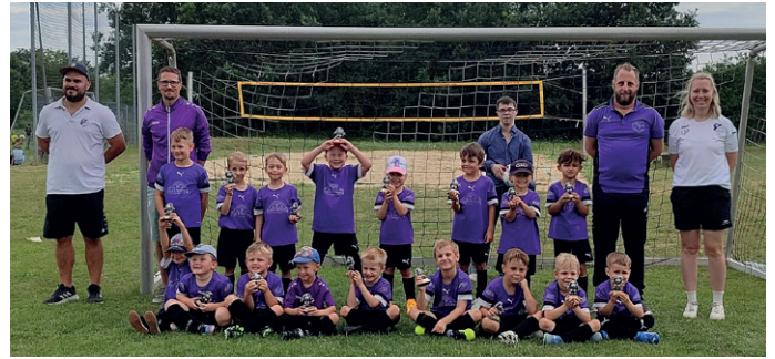
Festival beim TSV Hohenwart